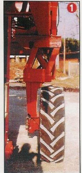
1 Carreggiata stretta in fase di trasferimento su strada (m. 2,10) Road transport wheel tread (m. 2,10)